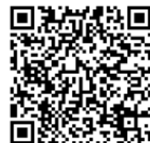
横浜市 粗大ごみ 2次元コード

粗大ごみの申込固定電話から は、電話:0570-200-530 携帯電話からは、 電話:045-330-3953